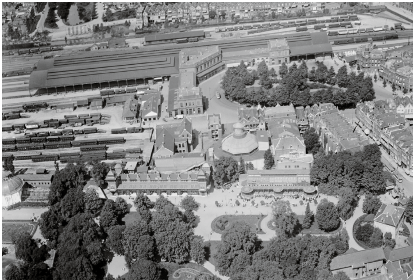
↑ Luchtfoto van station Delftsche Poort. In het midden de oude Rotterdamse Diergaarde, 1920.

In de nacht van 13 op 14 mei werd er niet gebombardeerd; het was de stilte voor de storm. Op andere dagen was de stad al wel getroffen door diverse luchtaanvallen. Bij een luchtaanval op zaterdag 11 mei vielen veertig burgerdoden, na een mislukte poging van de Luftwaffe om de politietroepen aan de Westersingel uit te schakelen. Het bombardement op Eerste Pinksterdag was gericht op de spoorwegstations Delftsche Poort, Beurs en Maasstation en op de Marinierskazerne. De bommen die bedoeld waren voor station Delftsche Poort vielen voor een deel op de nabijgelegen oude Diergaarde.