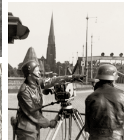
↑ Leden van een Duitse Propaganda Kompagnie, 1940.