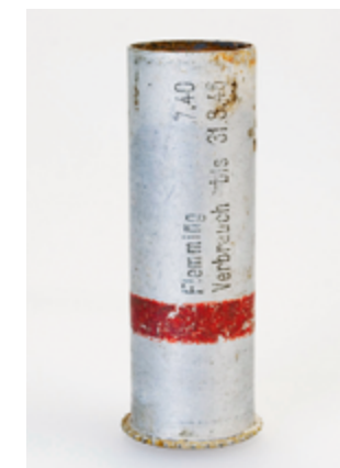
← Seinpistool met de huls van een lichtkogel.