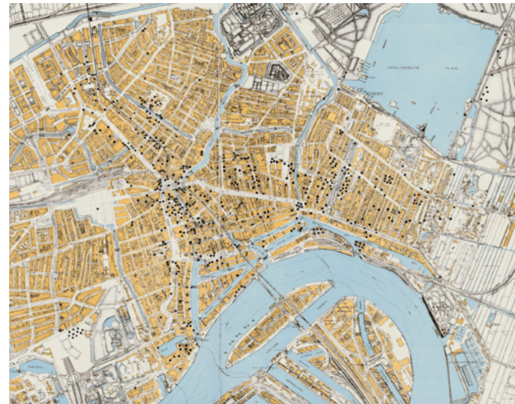
← Bommenkaart 1940. Bij de strijd om Rotterdam van 10 tot en met 14 mei 1940 vonden ten minste twintig luchtaanvallen plaats. Tien door de Luftwaffe, vijf door het Wapen der Militaire Luchtvaart en vijf door de Royal Air Force. Wat de stippen en kruisen op de bommenkaart aangeven is onduidelijk.